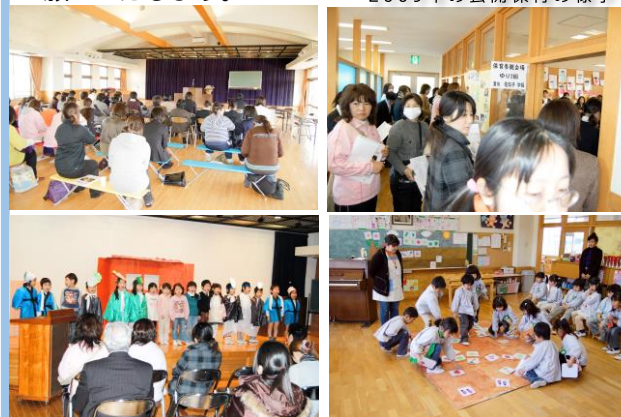
2009年の公開保育の様子

市内の保育園・幼稚園・小学校の先生方がゆり組の保育を参観します。当日は、たんぼぼ・かな組は半日保育(11:30降園)で帰りのバスの運行無し全員お迎えとなります。ゆり組はお弁当持参14:30降園で全員お迎えになります。なお、預かり保育もありませんのでご協力の程よろしくお願いたします。